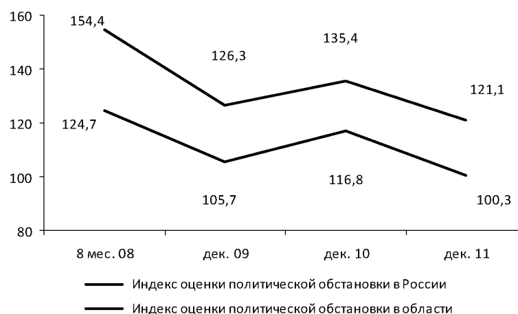
Рисунок 1. Динамика индексов оценки политической обстановки в России и области